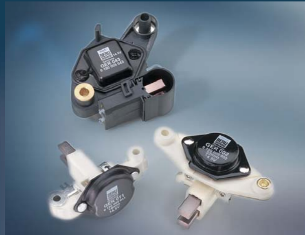
Beru Generatorregler Die Erweiterung des Beru Zündungsverschleißteile-Programms: Ein optimal auf den Bedarf der Werkstatt abgestimmtes Reglersortiment, sicher in der Zuordnung – und mit besonders attraktivem Preis-Leistungs-Verhältnis.