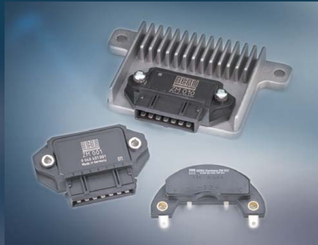
Beru Zündmodule Zündung und Elektronik aus einer Hand: das Beru Zündmodul-Programm – mit der vollen Zündungskompetenz des Spezialisten.